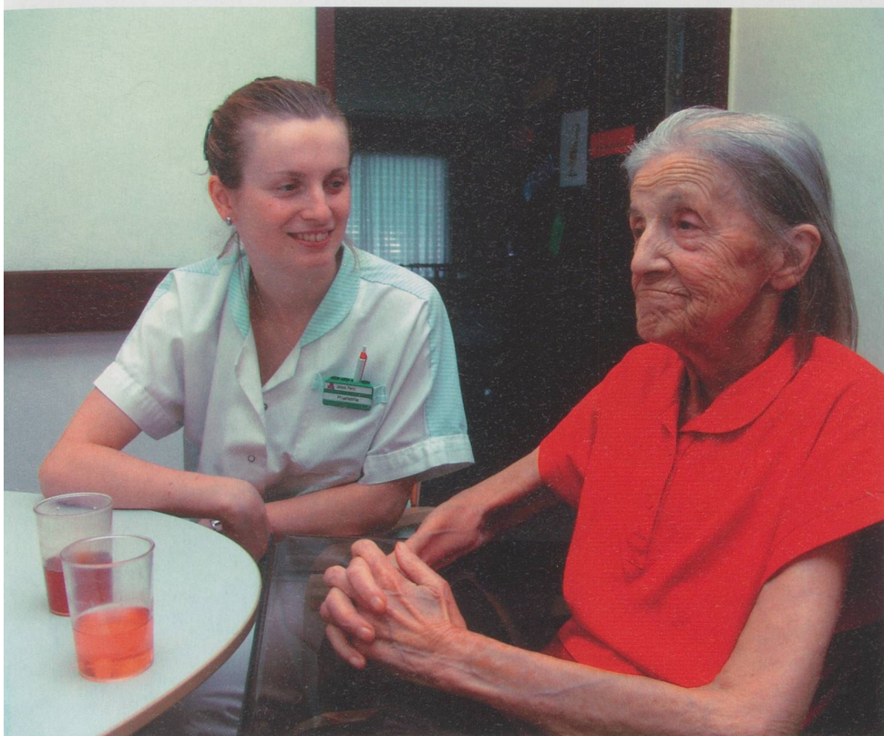
Am 25. September entscheiden die Schweizer Stimmberechtigten darüber, ob die Freizügigkeit auf die zehn neuen EU-Länder ausgedehnt wird. Im Erlenhof in Zürich arbeiten schon heute Menschen aus 35 Nationen.

Die Kommunikation mit den Patienten, die interdisziplinäre Zusammenarbeit mit anderen Berufsgruppen sowie die schriftliche Dokumentation sind feste Bestandteile der schweizerischen Berufspraxis. Ohne mündliche und schriftliche Sprachkompetenzen auch in der jeweiligen «Fachsprache» finden diese Personen kaum eine qualifizierte Anstellung in ihrem Beruf. Zudem hat die EU im Rahmen der gegenseitigen Anerkennung von Ausbildungsabschlüssen aus den zehn neuen Mitgliedstaaten vorgesehen, dass bei Diplomabschlüssen, welche vor dem Beitritt dieser Staaten zur EU abgeschlossen wurden und die inhaltlich von den Mindestvorgaben gemäss den sektoralen Richtlinien abweichen, zusätzliche Nachweise beruflicher