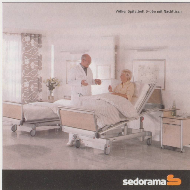
Völker Spitalbett S-960 mit Nachttisch

Mitglied der Fachhochschule Ostschweiz FHO