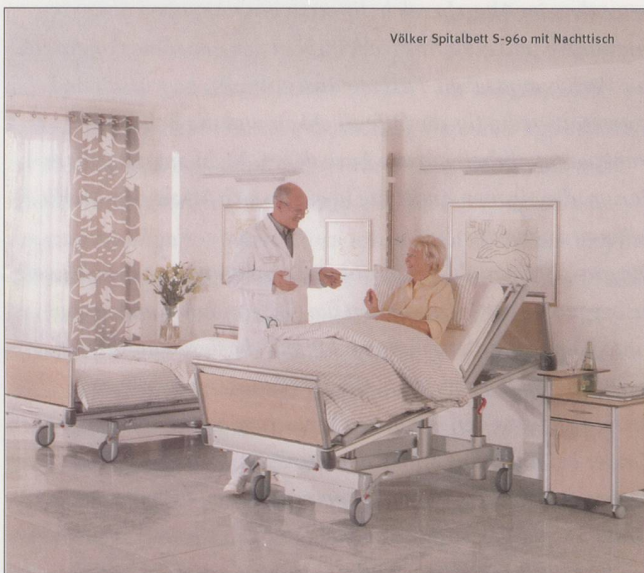
Völker Spitalbett S-960 mit Nachttisch

Mitglied der Fachhochschule Ostschweiz FHO