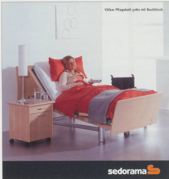
Völker Pflegebett 3080 mit Nachttisch