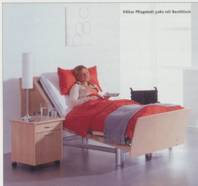
Völker Pflegebett 3080 mit Nachttisch