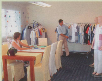
Ein Blick in den Show-Room in Rothrist zeigt, dass die Wimo AG über eine breite Auswahl an Berufsmode verfügt, die sie an der IGEHO zeigt.

Was die TKR-Methoden-Ermittlung bringt und welche harten und weichen Faktoren zu