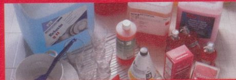
Reinigung und Pflege