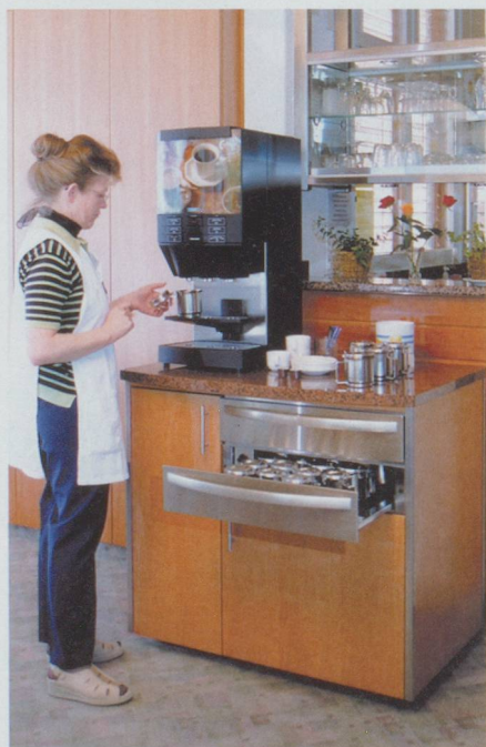
Cafitesse dezentral auf Stationen oder Etagen.

In Spitälern, Heimen, Tagungs- und Seminarhotels ist Cafitesse das ideale Kaffeesystem. Die Vorteile: Stets frischer Kaffee in erstklassiger Qualität. Kein Kaffeeverlust. Betriebssichere, bedienerfreundliche Maschinen für die zentrale, dezentrale, stationäre oder mobile Zubereitung. Beratung, Maschinen, Kaffee und Service aus einer Hand. Wahl zwischen zwei interessanten Verrechnungssystemen.