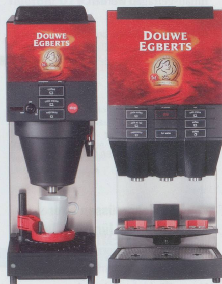
Cafitesse 120 und Cafitesse 400, verlangen Sie Detailprospekte.

1982 hat Repa AG die Cafitesse-Alleinvertretung für die Schweiz und das Fürstentum Liechtenstein übernommen. Sie wurde 1959 gegründet und befasst sich bereits seit 1965 mit der Installation und dem Service von Getränke-