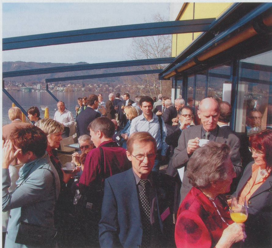
Angeregte Gespräche während der Kaffeepause der Tertianum-Fachtagung.