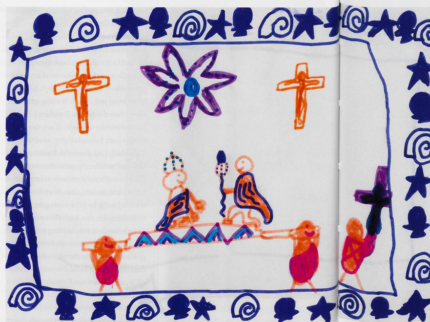
Eigener Zugang: Mit Zeichnungen und Spielsachen setzen sich Kinder mit dem Tod auseinander.

«Manche Kinder spüren, wie ernst krank sie sind und dass sie sterben werden, auch wenn sie es vielleicht