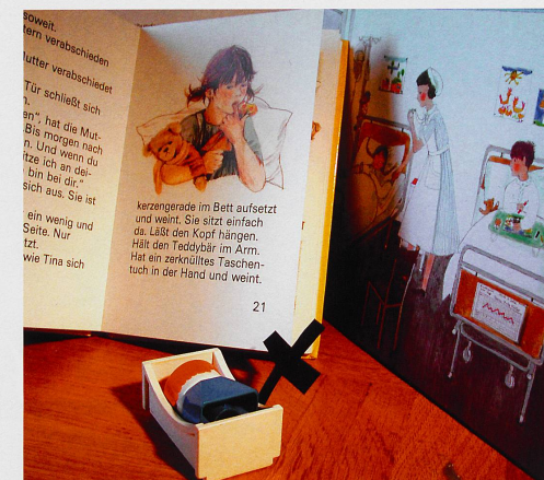
Inneres Wissen: Kinder, die sterben werden, scheinen das Unabwendbare zu spüren.

Blitz getroffener Elefant zu sehen war. «Obwohl man es wusste, hat man ihr nicht gesagt, dass sie bald sterben wird», sagt Di Gallo, «gespürt hat sie es trotzdem. Kurz vor ihrem Tod zeichnete sie den kranken Elefanten auf dem Operationstisch, beleuchtet von einer hellen Lampe, am Himmel weinte die Sonne.»