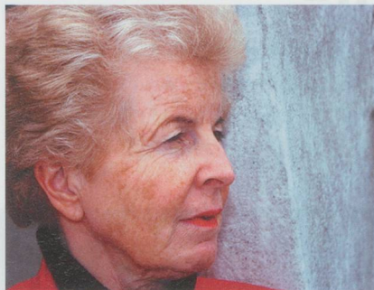
Vreni Spoerry über Glück, Leben und Tod 2