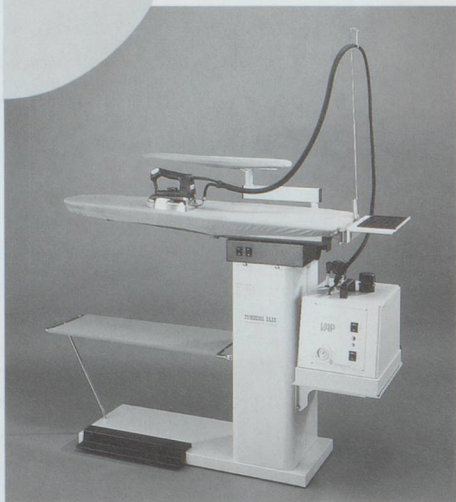
Die professionelle Bügelstation «DINO» kompakt – platzsparend – zuverlässig

1962–2002 40 Jahre Ihr Partner in der Bügelei!