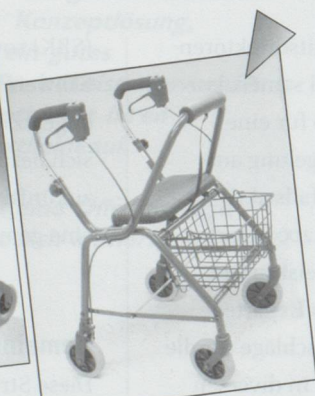
Rollator Modell WK018

Aktuelle Aktionen immer unter www.gloorrehab.ch !