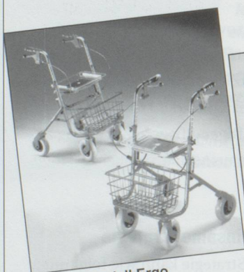
Rollator Modell Ergo

Inkl. Sitz, Korb und pannensicherer Bereifung. Farbe rot oder blau. Preis: Fr. 297.20 inkl. MwSt.