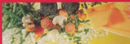
Frisch- und Tiefkühlprodukte