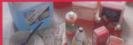
Reinigung und Pflege