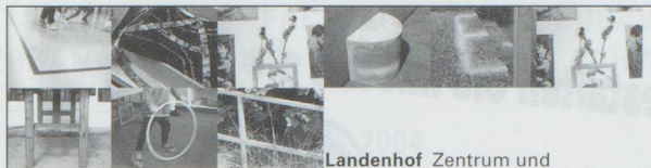
Landenhof Zentrum und Schweizerische Schule für Schwerhörige 5035 Unterentfelden

Wir freuen uns auf Ihre Bewerbung an: Stadtverwaltung Langenthal, Fachbereich Personal, Frau Beatrice Troxler, Jurastrasse 22, 4901 Langenthal.