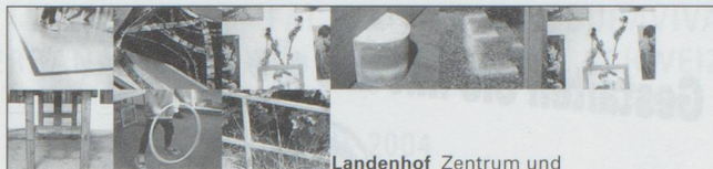
Landenhof Zentrum und Schweizerische Schule für Schwerhörige 5035 Unterentfelden

Wir freuen uns auf Ihre Bewerbung an: Stadtverwaltung Langenthal, Fachbereich Personal, Frau Beatrice Troxler, Jurastrasse 22, 4901 Langenthal.