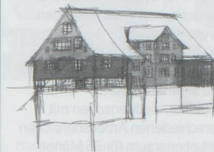
Wohn- und Beschäftigungsstätte Lindenweg

Gebäude des Wohnheims Lindenweg gemalt von Pius Zimmermann (Bewohner)