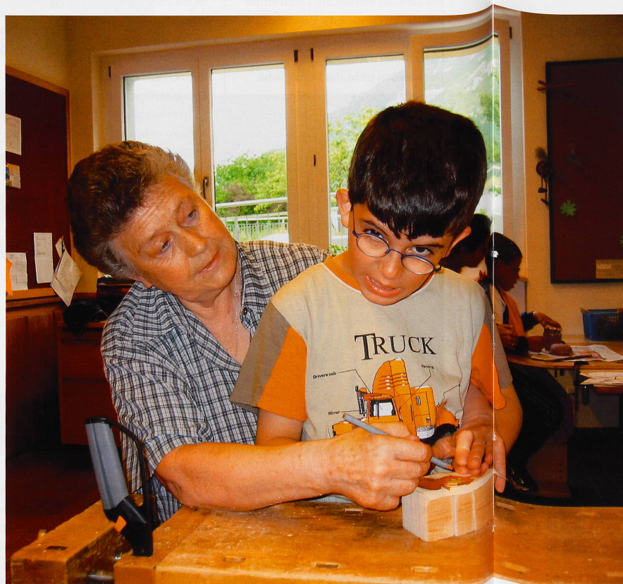
Ergotherapie im Schulheim Chur. Die IV limitiert die jährliche Zahl der Sitzungen auf maximal 40 und verlangt unabhängige neuropädiatrische Gutachten.

Grundsätzlich begegnen die Institutionen der Praxisänderung der IV mit Verständnis. Bei der schnellen Umset-