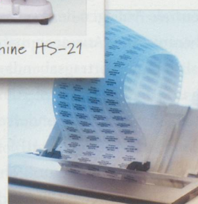
Plytex + EasyPrint