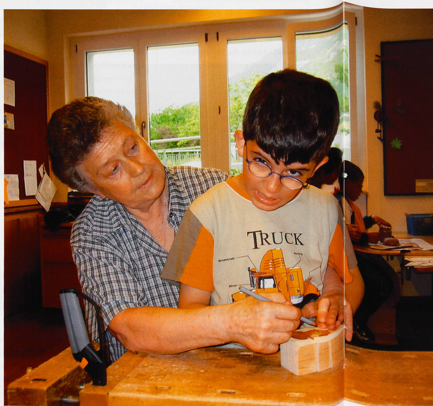
Ergotherapie im Schulheim Chur. Die IV limitiert die jährliche Zahl der Sitzungen auf maximal 40 und verlangt unabhängige neuropädiatrische Gutachten.

Grundsätzlich begegnen die Institutionen der Praxisänderung der IV mit Verständnis. Bei der schnellen Umset-