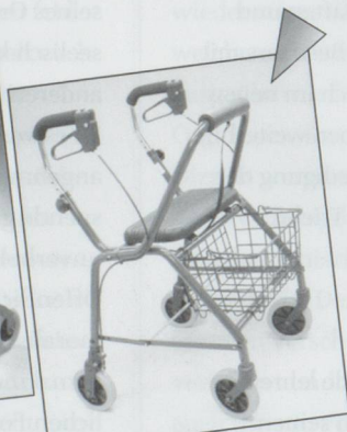
Rollator Modell WK018 Inkl. Sitz, Korb, pannensiche- rer Bereifung und gepolsterter Rückenlehne, Farbe blau. Preis: Fr. 300.20 inkl. MwSt.

Aktuelle Aktionen immer unter www.gloorrehab.ch !