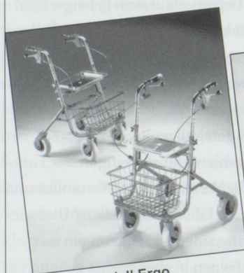
Rollator Modell Ergo Inkl. Sitz, Korb und pannensicherer Bereifung, Farbe rot oder blau. Preis: Fr. 297.20 inkl. MwSt.