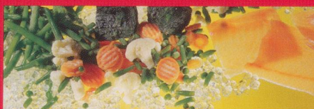
Frisch- und Tiefkühlprodukte