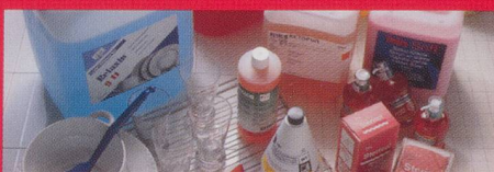
Reinigung und Pflege