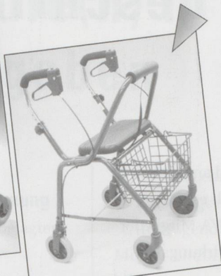
Rollator Modell WK018 Inkl. Sitz, Korb, pannensicherer Bereifung und gepolsterter Rückenlehne. Farbe blau. Preis: Fr. 300.20 inkl. MwSt.

Aktuelle Aktionen immer unter www.gloorrehab.ch !