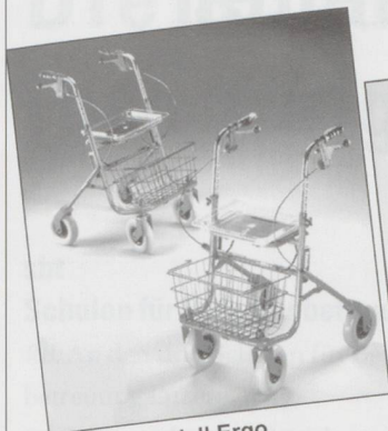
Rollator Modell Ergo Inkl. Sitz, Korb und pannensicherer Bereifung. Farbe rot oder blau. Preis: Fr. 297.20 inkl. MwSt.