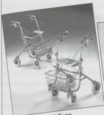
Rollator Modell Ergo Inkl. Sitz, Korb und pannensicherer Bereifung. Farbe rot oder blau. Preis: Fr. 297.20 inkl. MwSt.