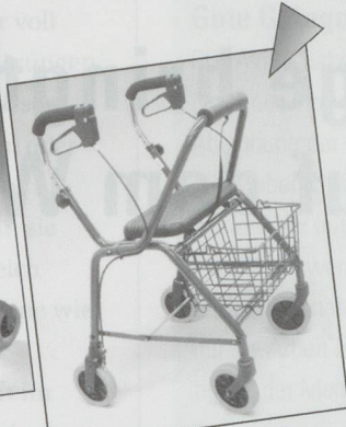
Rollator Modell WK018 Inkl. Sitz, Korb, pannensiche- rer Bereifung und gepolsterter Rückenlehne. Farbe blau. Preis: Fr. 300.20 inkl. MwSt.

Aktuelle Aktionen immer unter www.gloorrehab.ch !