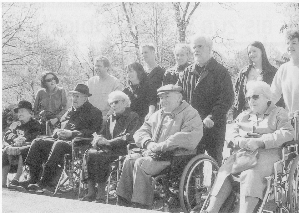
Freiwillige und Betagte in einer Rollstuhlreihe.