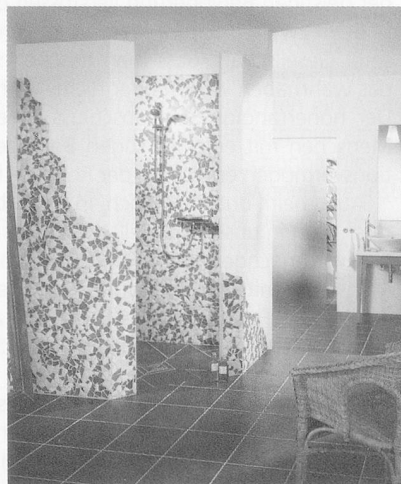
Fünfeckige Fundo mit Diagonaleinstieg

Die wedi Fundo, das verfliesbare Unterbodenelement zur Herstellung bodengleicher Duschen, hat sich als praktisches und einsatzbewährtes Produkt erwiesen. Das vorgegebene Gefälle und