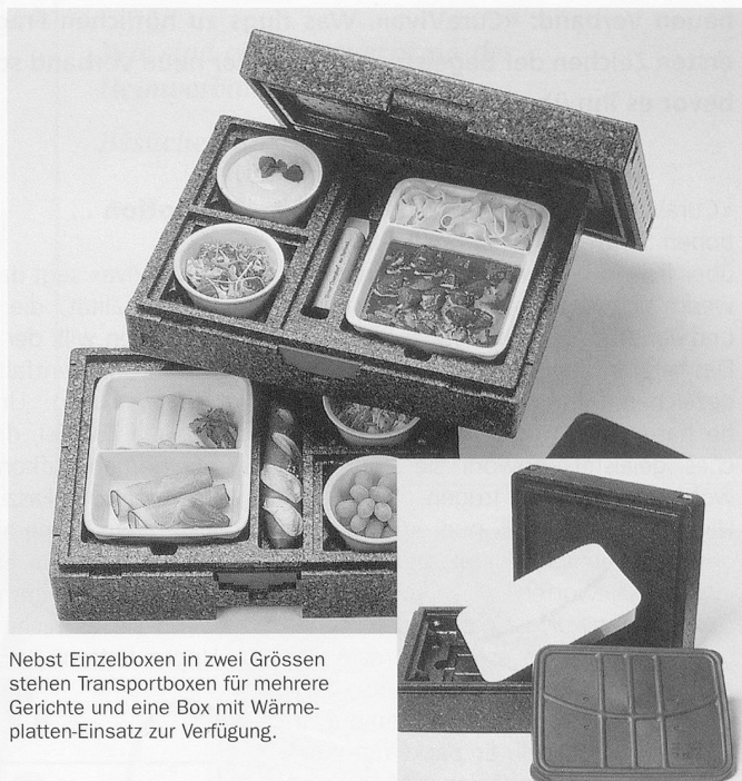
Nebst Einzelboxen in zwei Grössen stehen Transportboxen für mehrere Gerichte und eine Box mit Wärmeplatten-Einsatz zur Verfügung.

Das System für Hauslieferdienste (z.B. Seniorenverpflegung) und Caterer ist in jeder Hinsicht durchdacht: Die Menü- und Beilagenschalen aus Porzellan gibt's in verschiedenen Teilungen und Grössen. Und die Deckel dazu, zur Kennzeichnung des Inhalts, in fünf Farben.