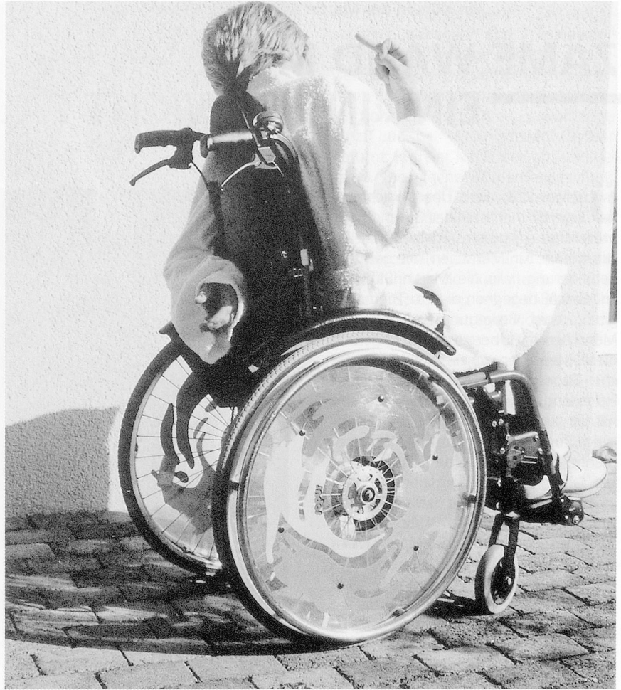
Abschied: Es gilt Abschied zu nehmen vom auch in der Heilpädagogik traditionsreichen medizinischen Modell mit uneingeschränkter Expertenmacht der professionellen Helfer und Helferinnen.