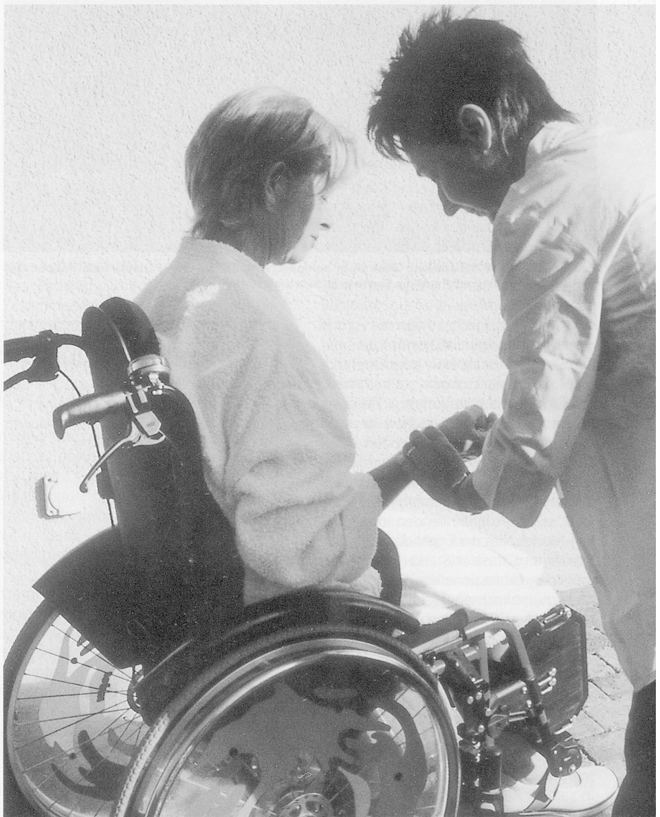
Versorgung: Wie sieht der Alltag der medizinischen Versorgung behinderter Menschen aus?

Und auch das Menschenbild verändert sich: