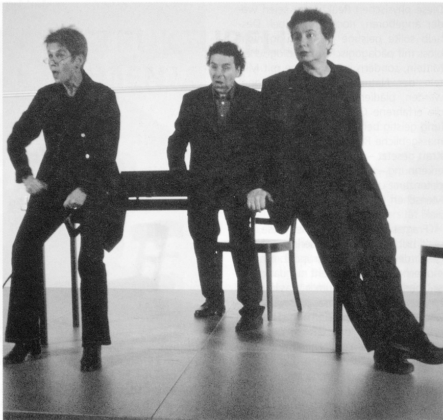
Cabaret Birkenmeiers: «Wir sind kein Goldfisch, wir sind das Gold.»