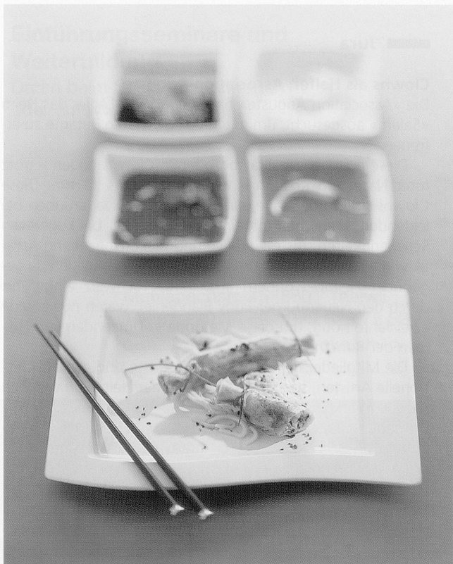
Das kreative und trendige Hotelporzellan von Villeroy & Boch hilft Akzente zu setzen und sich mit speziellen Angeboten zu profilieren.

Die Berndorf Luzern AG erweitert ihr Angebot im Bereich Gastronomie und Speiseverteilung. Per 1. Mai 2002 werden neben der Marke Bauscher neu auch die Hotelporzellan-Produkte von Villeroy & Boch angeboten.