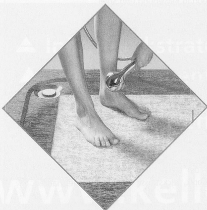
SECURSTONE-Duschenasse aus Granit. Damit Sicherheit im Badezimmerbau nicht bei Individualität endet.

Öffnungszeiten: Dienstag bis Samstag von 9 bis 12 und 14 bis 17 Uhr. (Gruppenführungen nur auf Voranmeldung)