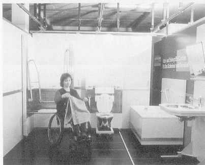
Alle Einrichtungen lassen sich individuell installieren und ausprobieren.*

Die Hilfsmittelausstellung Exma in Oensingen bietet für die Umbauplanung nun eine absolute Neuheit an: Das anpassbare Badezimmer. Wände, Badewanne, Dusche, WC und Lavabo der Installation können so lange verschoben oder entfernt werden, bis man das geplante Badezimmer 1:1 nachgebildet hat. So können Probleme erkannt und beseitigt werden, noch bevor sie zu teuren Fehlplanungen geworden sind.