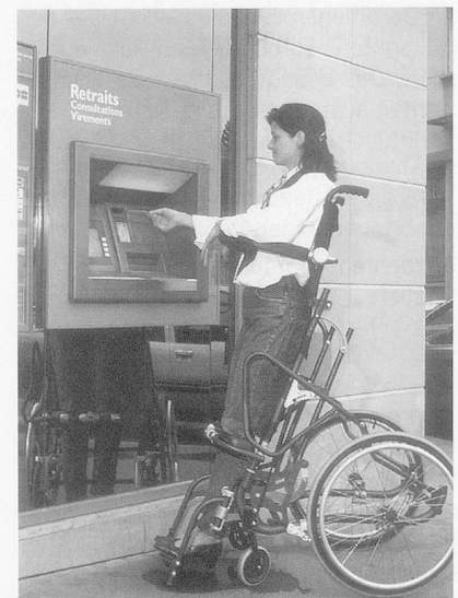
Der Aufrichtrollstuhl Lifestand.*

Sitzbreite 36/40/44/48 cm Sitztiefe 44/56 cm Gesamtgewicht 22/23/24/25 kg