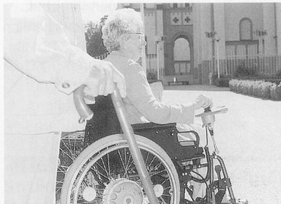
Der Elektroantrieb für Rollstühle e-fix E20.

Der Fortschritt der Technik manifestiert sich vor allem in der Bedienerfreundlichkeit. Als Neuheit bietet der E20 je einen Fahrmodus für den Innen-