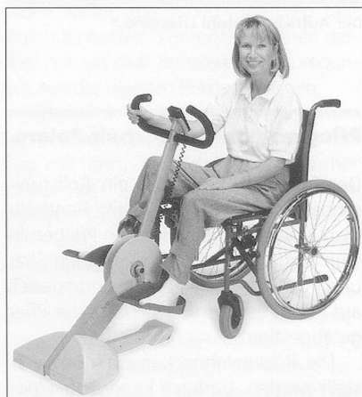
Der Bewegungstrainer THERA live.

Tägliche Bewegung ist eine der Grundvoraussetzungen dafür, die Funktionen unseres Körpers intakt zu halten und