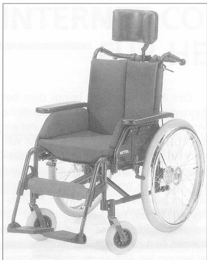
Der Pflegerollstuhl Eurochair Polaro.

und Benutzer beschwerdefrei länger im Rollstuhl sitzen. Ein optional erhältlicher, anatomisch geformter Rückenteil bietet eine ideale Rumpfunterstützung und einen guten Seitenhalt. Wichtig ist dabei die stabile Beckenpositionierung, die durch den bei Bedarf anpassbaren Ergoformsitz gewährleistet ist. Eine verstellbare Sitzkantelung ist nicht möglich, kann aber über Fahrwerkeinstellungen zwischen 0° und 4° erreicht werden.