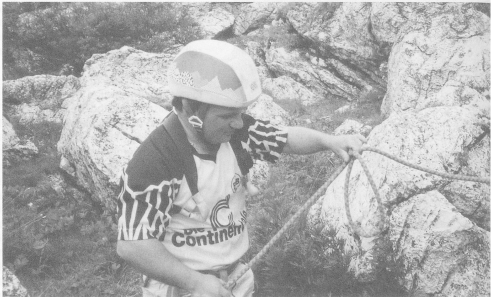
Beim Knoten üben