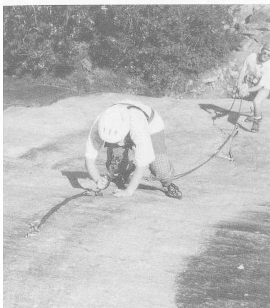
Klettern im Vorstieg auf geneigten Granitplatten im Engadin