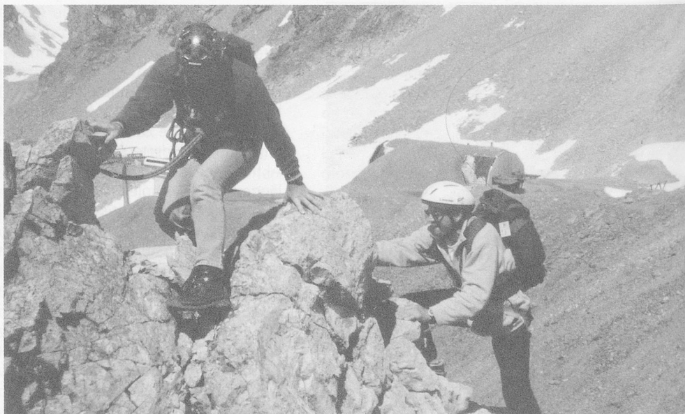
Über den schmalen Grat zum Gipfel