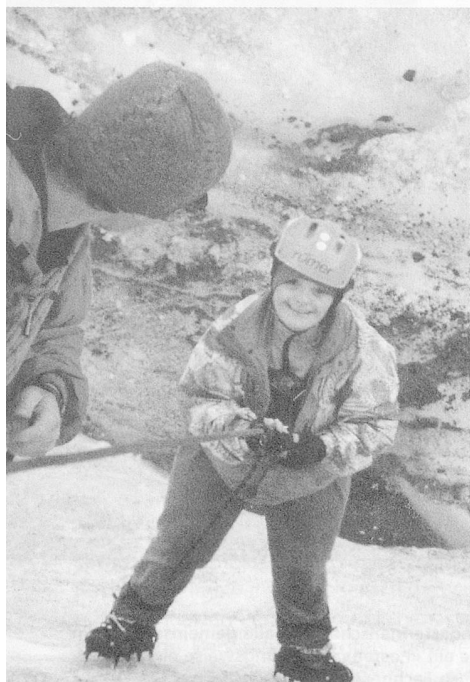
Beim Abseilen auf dem Gletscher

Die Plenumsdiskussion brachte zu Tage, dass die grössten Schwierigkeiten bei der Realisierung dieses Integrationsgedankens insbesondere im Bereich Hemmungen und Ängste vor dem Umgang mit behinderten Menschen liegen. Für viele Kursteilnehmer stand denn auch die Frage im Vordergrund, wo und wie sie zusätzliche Erfahrung sammeln können, ohne gleich selber solche Aktivitäten als Hauptverantwortliche durchführen zu müssen.