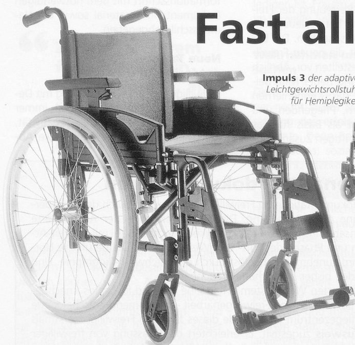
Impuls 3 der adaptive Leichtgewichtsrollstuhl für Hemiplegiker