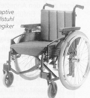
Impuls 2 und Impuls 3: • Sitz- tiefenverstellung serienmässig • Sitzhöhen von 40-53 cm (Impuls 2) und 36-42 cm (Impuls 3) • verschiedene Armlehnen und Beinstützen wählbar • modularer Rücken, höhen- verstellbar • winkel- und tiefen- verstellbare Fussplatte möglich (Impuls 2) • versetzbare Castor- buchse für bestmögliche Fussfreiheit zum Trippeln und Lenken (Impuls 3)

Aus der ORTOPEDIA Leicht- gewichts-Rollstuhlfamilie Impuls bieten diese beiden Modelle Eigenschaften, die fast alles möglich machen: Modul-Bauweise, optimaler Wiedereinsatz und hohe Wirtschaftlichkeit. Dazu gehört auch umfangreiches Zubehör. Überzeugen Sie selbst von den vielfältigen Möglichkeiten. Ihr ORTOPEDIA-Händler wird Sie gerne umfassend beraten und informieren.