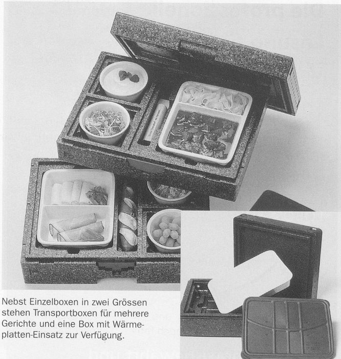
Nebst Einzelboxen in zwei Grössen stehen Transportboxen für mehrere Gerichte und eine Box mit Wärmeplatten-Einsatz zur Verfügung.

Das System für Hauslieferdienste (z.B. Seniorenverpflegung) und Caterer ist in jeder Hinsicht durchdacht: Die Menü- und Beilagenschalen aus Porzellan gibt's in verschiedenen Teilungen und Grössen. Und die Deckel dazu, zur Kennzeichnung des Inhalts, in fünf Farben.