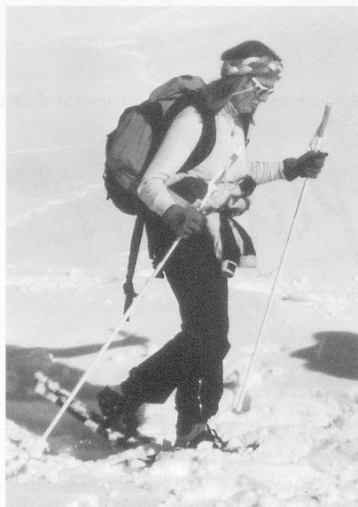
... im frischen Pulverschnee.