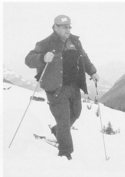
Unterwegs beim Schneeschuhlaufen...

Im Bereich des Breitensports richten sich alle Angebote an körper-, sinnes- und