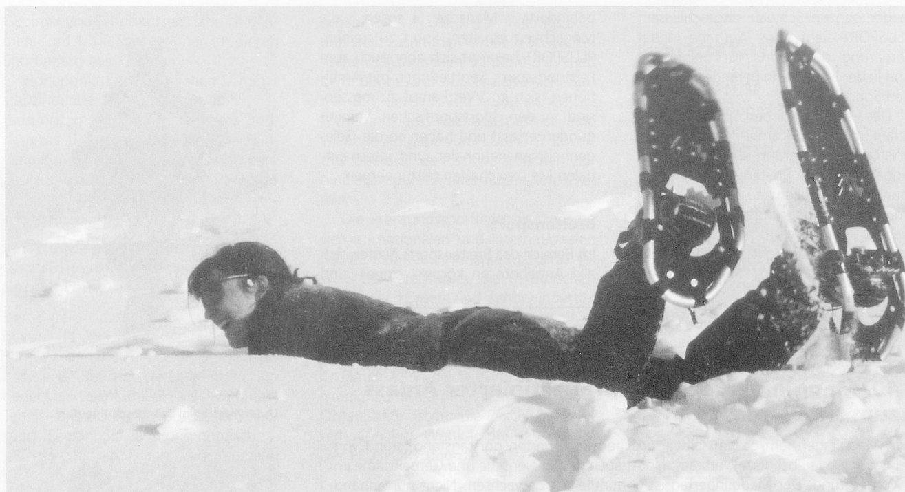
Gut vorbereitete Schneeschuhtouren sind für die geistig behinderten Menschen wie für ihre Begleitpersonen ein Vergnügen.