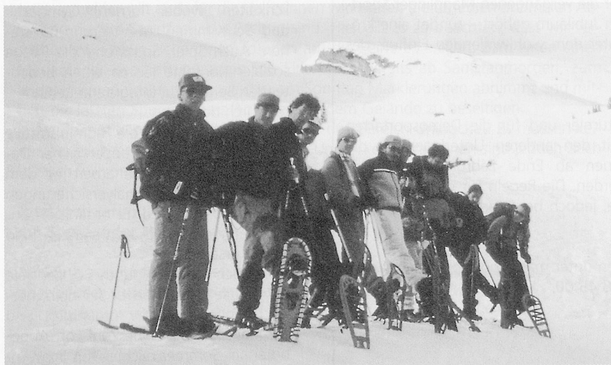
Schneeschuhtouren ermöglichen mit relativ geringem Aufwand auch Menschen mit einer geistigen Behinderung einen Aufenthalt in der winterlichen Bergwelt.

Das neue Leitbild zeigt PLUSPORT Behindertensport Schweiz als Dachverband des Behindertensports. Heute sind dem PLUSPORT rund 85 Sportgruppen und 7 Sportfachvereinigungen sowie Kollektivmitglieder mit gegen 10 000 SportlerInnen und fast 1000 LeiterInnen