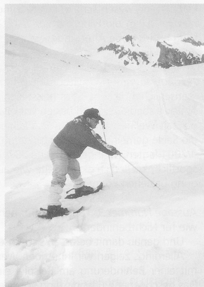
Bei der Tourenplanung muss genügend Zeit eingerechnet werden für spielerischen Umgang mit dem Material Schnee wie etwa zum Zeichnen (im Lidernengebiet).

Unsere Spur führt über sanfte Hügel in einen Sattel, der sich infolge einer kleinen Wechte als Schlüsselstelle der heutigen Tour herausstellt. Mit gegenseitigem Ziehen und Stossen gelingt es uns, diese Stelle zu meistern und wenig später stehen wir auf dem Gipfel des Glattwang. Einmalige Aussicht, ein tiefes Glücksgefühl und Stolz über die vollbrachte Leistung lassen manchen Freudenschrei ertönen. Ein kräftiger Schluck Tee aus der Thermosflasche und ein tiefer Griff in den Lunchsack bringen die verdiente Stärkung. Der Abstieg steht uns ja noch bevor. Springend und stolpernd, aber zügig geht es über die weiten Hänge hinunter in die Heuberge, wo wir schon bald inmitten der Skifahrer beim Tee sitzen, erzählen, spielen und