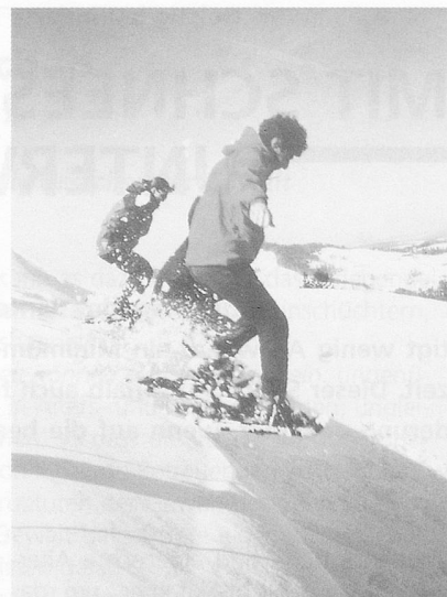
Wechtenspringen entwickelte sich zur bevorzugten Schneeschuhdisziplin.

Ein grosse Herausforderung für geistig behinderte Menschen ist neben der sportlichen Aktivität das Übernachten in ungewohnter Umgebung. Meist etwas engere Platzverhältnisse, oftmals eingeschränkte sanitärische Einrichtungen, fremde Leute und vielleicht sogar fehlende Elektrizität können bereichernd wirken und spontane, für alle Seiten in-