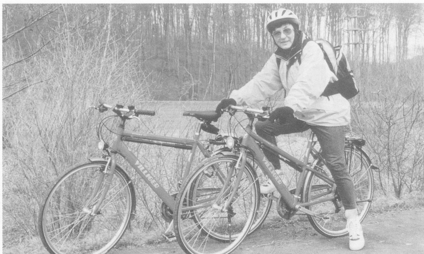
Vier Räder einmal anders: gemeinsamer Spass.

Wellness ist aber auch das Gegenteil von «aktiv-sein». Die zweite gerontologische Forschungsrichtung beschreibt, dass Rückzug Wohlbefinden auslösen kann. Der Philosoph Ernst Bloch beschreibt in seinem Werk «Das Prinzip Hoffnung» die These, dass der ältere Mensch ein vermehrtes Bedürfnis nach Ruhe habe 3 . Diese Ruhe werde auch benötigt, um von Vergangenen Abschied zu nehmen, Fehlleistungen und Versäumnisse zu verarbeiten oder zu korrigieren und dadurch das gesamte Leben erträglicher zu machen. Die gerontologische «Disengagement-Theorie» greift dieses Bild auf, fügt jedoch auch positive Aspekte hinzu. Älterwerden bedeutet nicht nur Rückzug zum