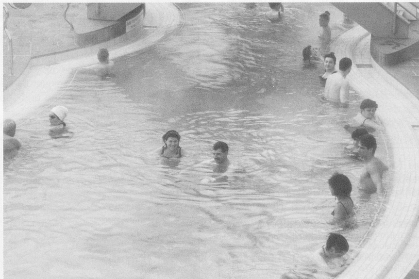
Wellness hat viele Gesichter: Es muss nicht immer Hochleistung sein. Entspannung gepaart mit Therapie bietet das Thermalbad.