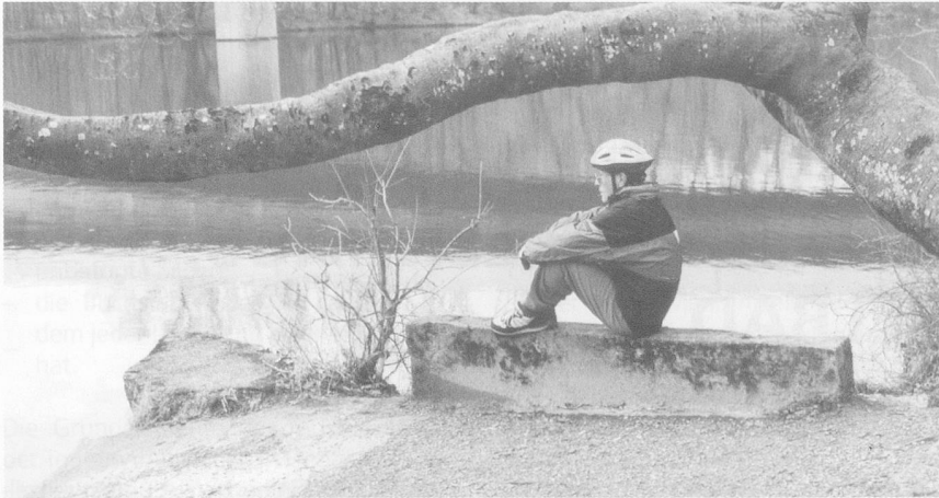
Unterwegs sein – so dass die Seele Zeit hat für den Weg.