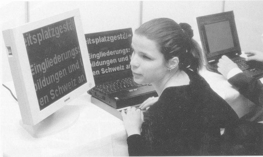
Eine sehbehinderte Frau am Computer, der vorne, zusätzlich zur normalen Tastatur, mit den Zeichen der Blindenschrift versehen ist. Die gewöhnliche Maschinenschrift kann bis 60fach vergrössert werden.

hinderte mehr, als Nichtbehinderte. Weber: «Jeder Mensch soll einen Arbeitsplatz erhalten, der seinen Möglichkeiten entspricht.»