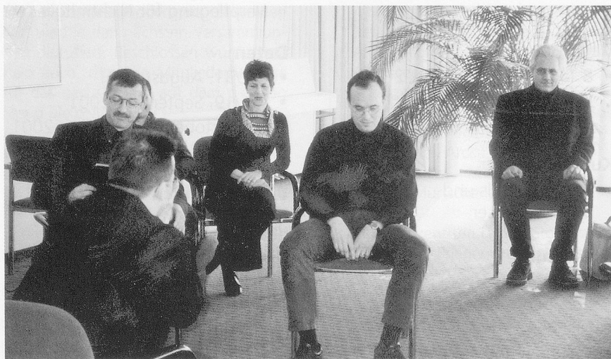
Die Präsentationen der Projektarbeiten ...

Ausgehend von Gedanken zum Thema Humor im Allgemeinen, stellen die Teilnehmerinnen in ihrer Arbeit zunächst einige Reflexionen zum eigenen Verständnis von Humor im Führungs- und Heimalltag an. In einem nächsten Schritt analysieren sie die Kräfte und Wirkungen von Humor. Für die Gruppe ist Humor eine Kraft, die es erlaubt, sich von