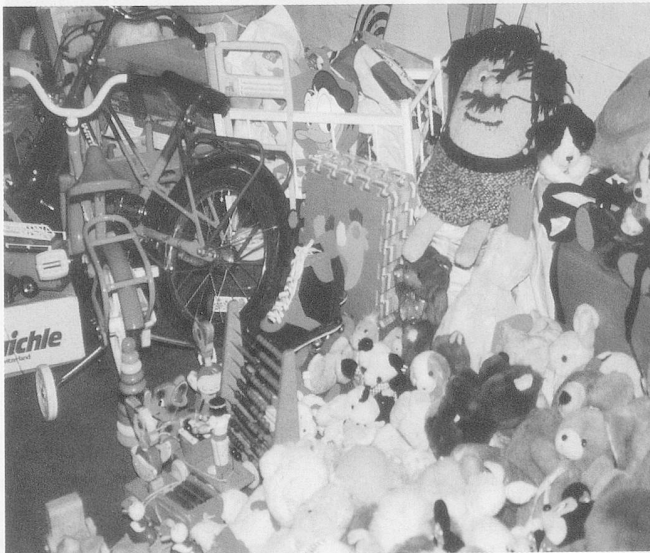
Eine Invasion von Plüschtieren...

Wir umfahren Zürich, suchen Schleichwege. Trotzdem, die Rückfahrt in Richtung Brugg wird zur Nervenprobe. Der Jeep zeigt steigende Temperaturen an. Uns wird heiss: Was ist los? Schaffen wirs oder schaffen wirs nicht?