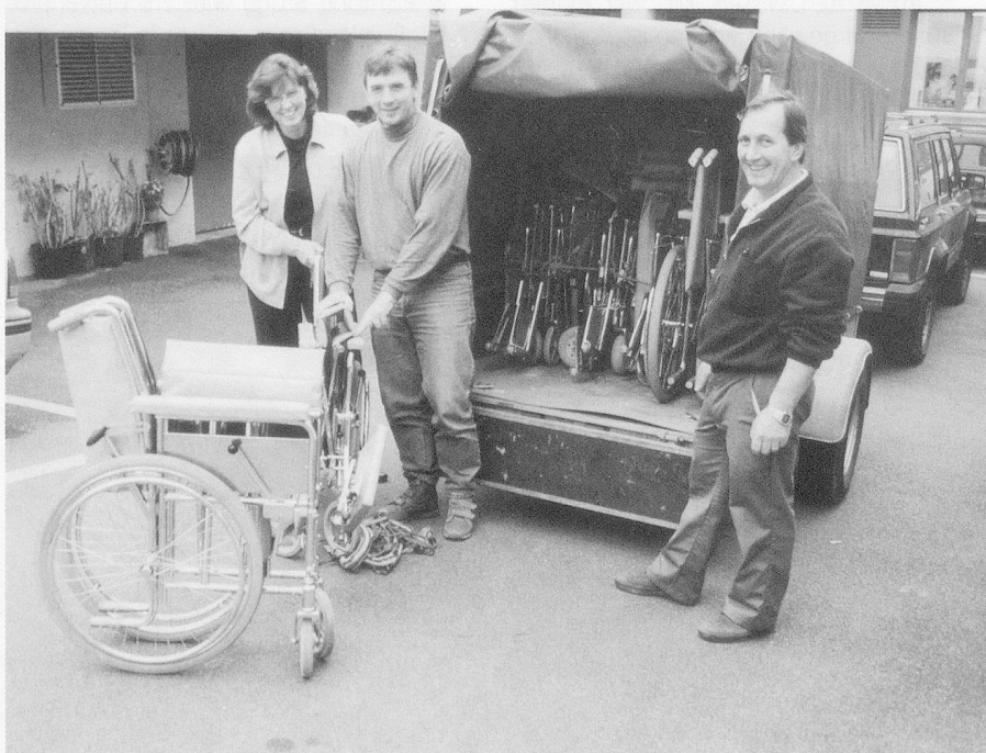
...als Ergänzung zum Alltagsmobiliar.

21 Uhr 30. Der Computer wird aufgestartet. Es ist eine Wonne, die Inventarlisten für die Spielsachen aufzustellen. Dazu kommen insgesamt 100 Tafeln Schokolade.