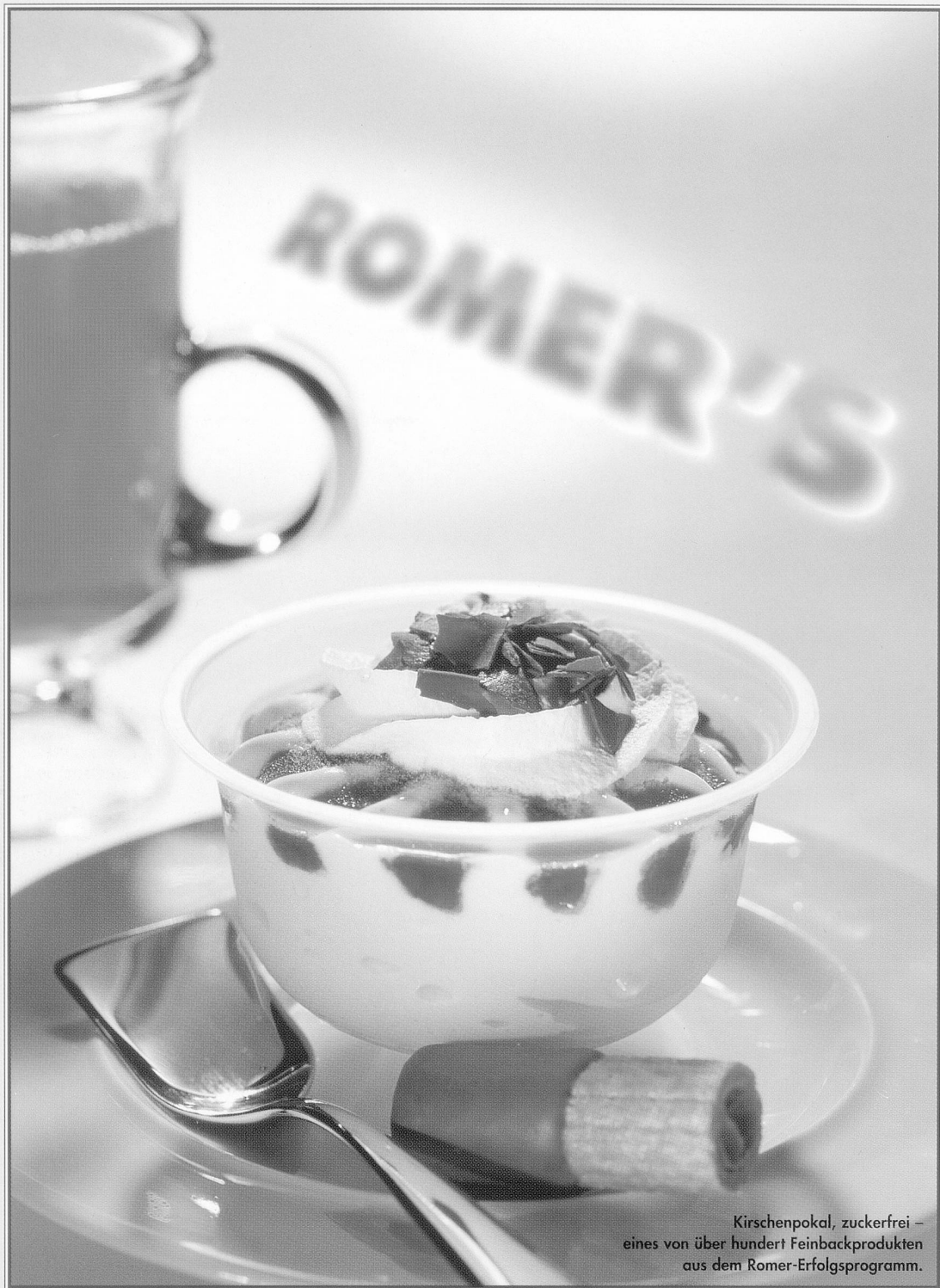
Kirschenpokal, zuckerfrei – eines von über hundert Feinbackprodukten aus dem Romer-Erfolgsprogramm.