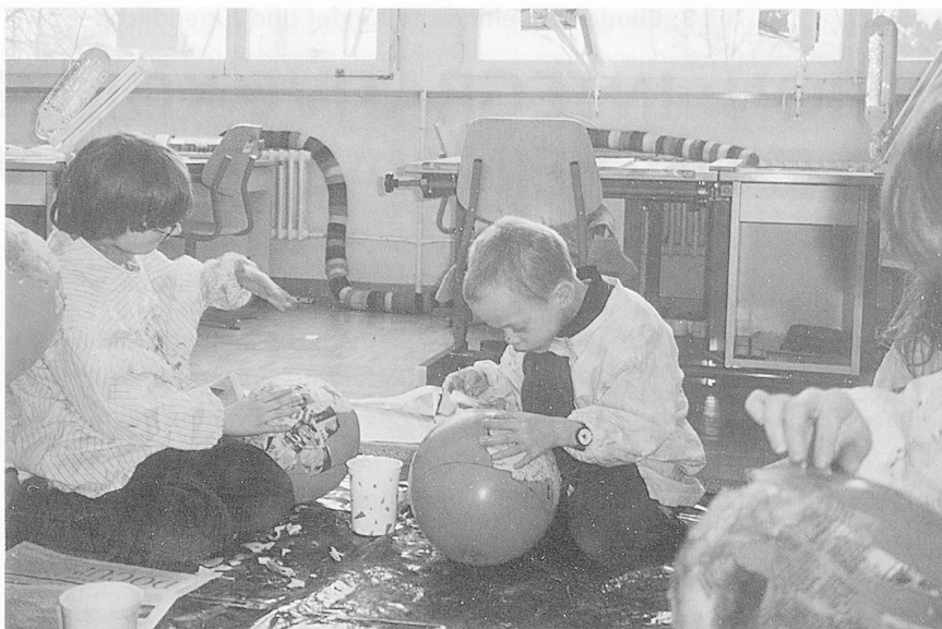
Iglu basteln in der 1. Klasse der Schule für blinde und sehbehinderte Kinder und Jugendliche in Zollikofen BE.

Diese Entwicklung hat in unserer Institution unter anderem auch dazu geführt, dass das Eintrittsalter der Kinder unterschiedlicher geworden ist.