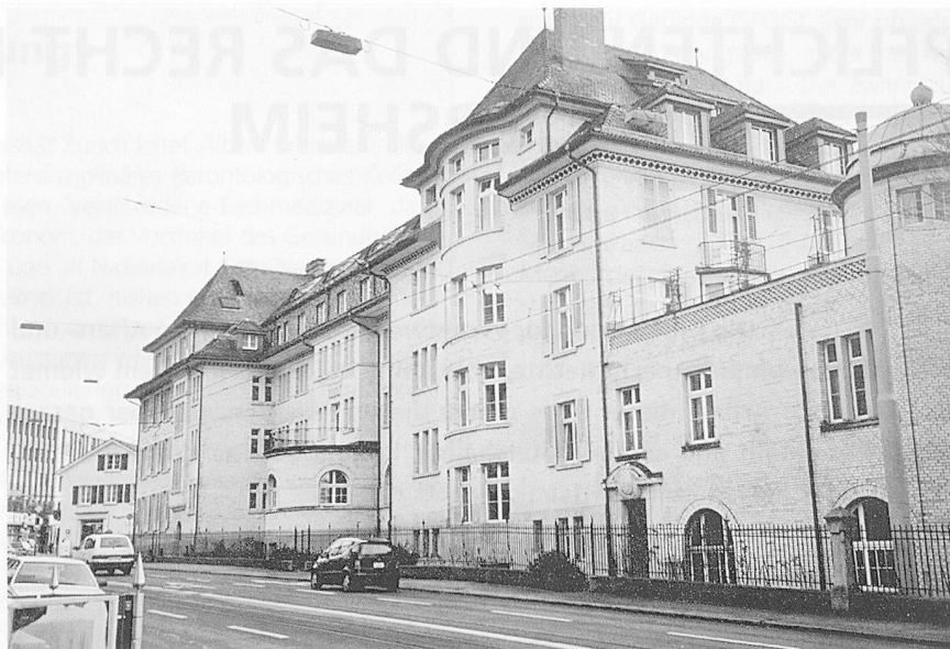
Ein grosszügiger Bau: Das städtische Altersheim Klus.

«Wir wollen uns vermehrt normal verhalten», ist ein Schlüsselsatz Elbers aus der Zeit des Umbruchs. Wurden alte Menschen, im Heim ganz besonders, in der Vergangenheit viel zu oft automatisch als krank und hilflos abgestempelt und richtiggehend ins Bett gepflegt, so sollte dies in Zukunft ganz anders sein. All die negativen Faktoren, die alte Menschen davon abhalten, die Wohnform Altersheim auszuwählen, sollten in positive umgedreht werden: Das Haus soll offen sein für alle, der Blick nicht nur nach innen, sondern auch nach aussen gerichtet sein und die Wünsche der zukünftigen BewohnerInnen wahrgenommen werden, die PensionärInnen sollen mitbestimmen und mitwirken können, und ein neues, kundenfreundliches Aufnahmeverfahren ohne lange Wartelisten soll einen rechtzeitigen Eintritt ermöglichen.