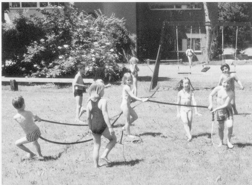
...oder sonnige Aussichten? (Sommerliches Spiel an der Heilpädagogischen Schule Uster)