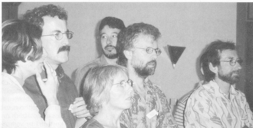
Blicke an die Flip-charts: Workshop-Thema auswählen.