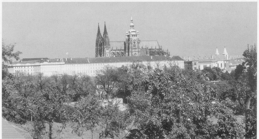
Septembertag in Prag: Das Gold des Herbstes über der Goldenen Stadt.