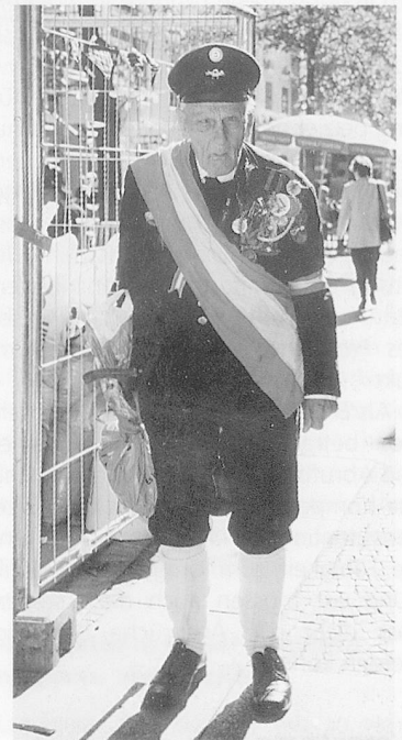
Alt werden: Auch in Österreich nicht für alle ein Zuckerschlecken. Ein 77-jähriger Wiener, der früher in der Leichenbestattung arbeitete und heute in einem Obdachlosenheim wohnt.

Institutionalisierte Wohnformen (Pensionisten-, Alters-, Pflegeheime u.ä.), von denen es in Österreich rund 700 Einrichtungen mit 41 000 Pflegeplätzen gibt (Zahlen von 1996/97), sind gemäss der Publikation vor allem als ergänzende Wohnangebote bedeutend: «Vielfach wird aber kritisiert, dass entsprechende Heime in der Regel viel zu gross sind (meist mehr als 200 Wohnplätze) (...) Den Bedürfnissen älterer Menschen besser entsprechen würden kleinere Heime mit Wohncharakter.» Dass es mit dem Image der Heime im Bericht des Bundesministeriums nicht gerade zum Besten steht, kommt auch im Vorwort von Martin Bartenstein zum Ausdruck, wo im Hinblick auf die Heime nur gerade zu lesen ist: «Schliesslich ist auch die Sicherung der Rechte von SeniorInnen in Heimen und Pflegeeinrichtungen ein Massstab dafür, welchen Stellenwert ältere Menschen in unserer Gesellschaft haben. Mit unserer Bundesseniorenanwaltschaft haben wir dafür nun ein wirksames Instrument zur Verfügung.»