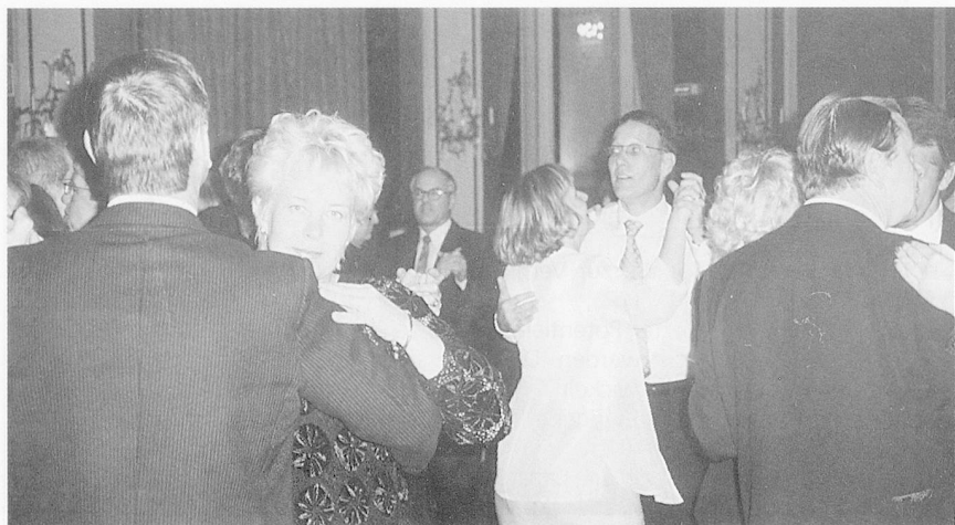
Galaabend im Kursalon Stadtpark: Wien live mit Walzertanz.