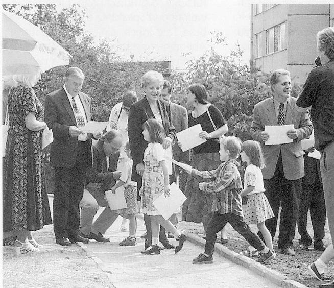
...und beschenkten die Gäste mit ihren Bildern.