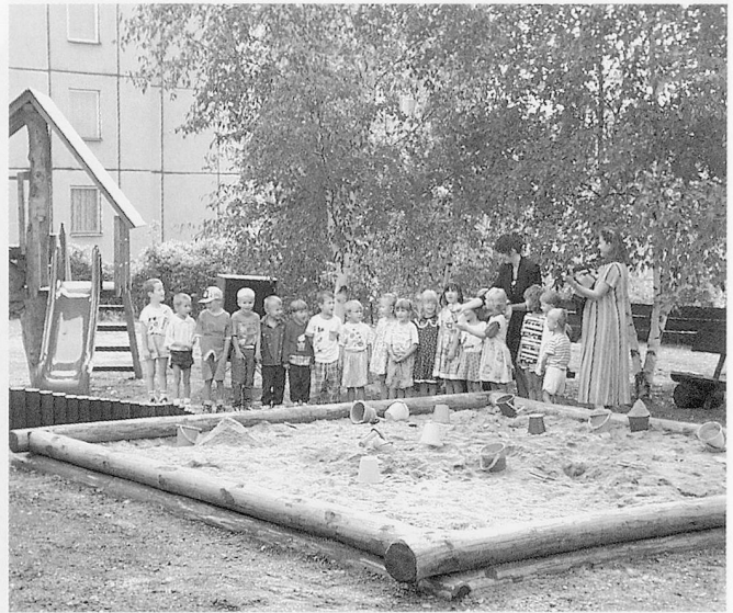
Als Dank für den Spielplatz gaben die Kinder vom gegenüberliegenden Kindergarten ein Ständchen...