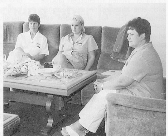
Willkommen in Horni Briza, Region Pilsen: Das Heim, vor 25 Jahren in die Landschaft gestellt ... und finanziell vergessen?