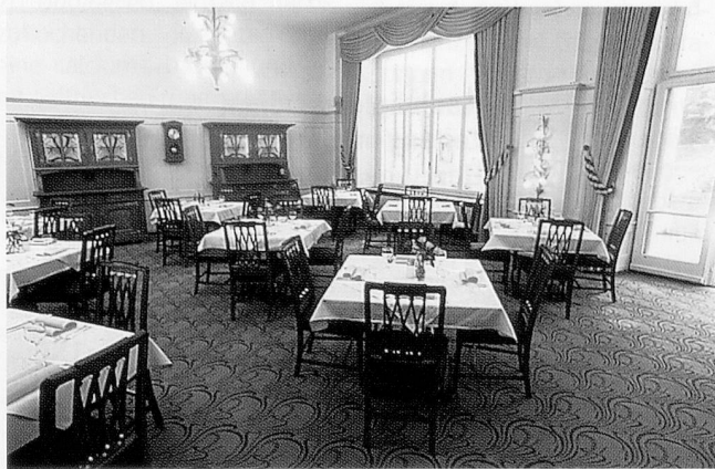
Der ausgesuchte Teppichboden im Speisesaal des Altersheim Singenberg verleiht dem Raum eine individuelle Note.

keit, Strapazierfähigkeit und Reinigungsverhalten des Bodenbelags, beurteilt. «Nach eingehenden Abklärungen und Testverfahren entschied man sich für einen hochwertigen textilen Bodenbelag, der mit den übrigen Einrichtungsgegenständen in Einklang steht», gibt Therese Bucher zu verstehen. Dank den vielfältigen Gestaltungsmöglichkeiten, die textile Bodenbeläge auszeichnen, ist es dem Altersheim Singenberg gelungen, seinen eigenen Stil zu finden, der auch bei seinen Bewohnern auf breite Akzeptanz stösst.