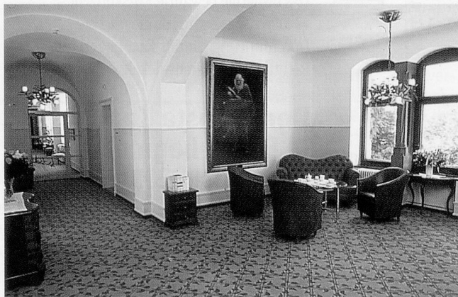
Sitzmöbel und Teppichboden sind farblich abgestimmt und verleihen der Raumzone im Altersheim Singenberg eine angenehme Atmosphäre.