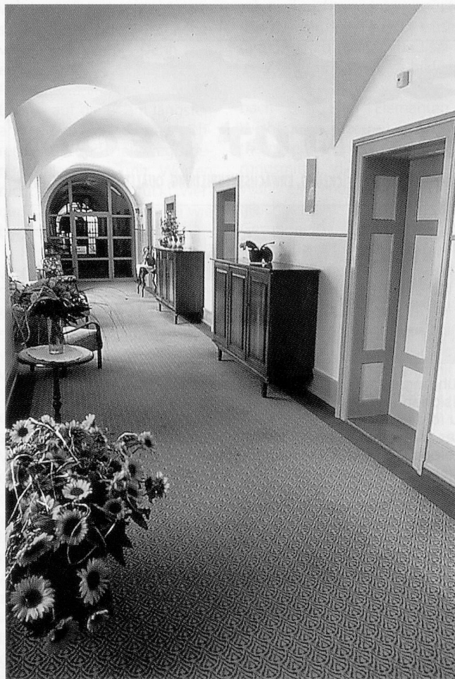
Dank des Teppichbodens in den Korridoren wird der Trittschall wesentlich gedämpft.