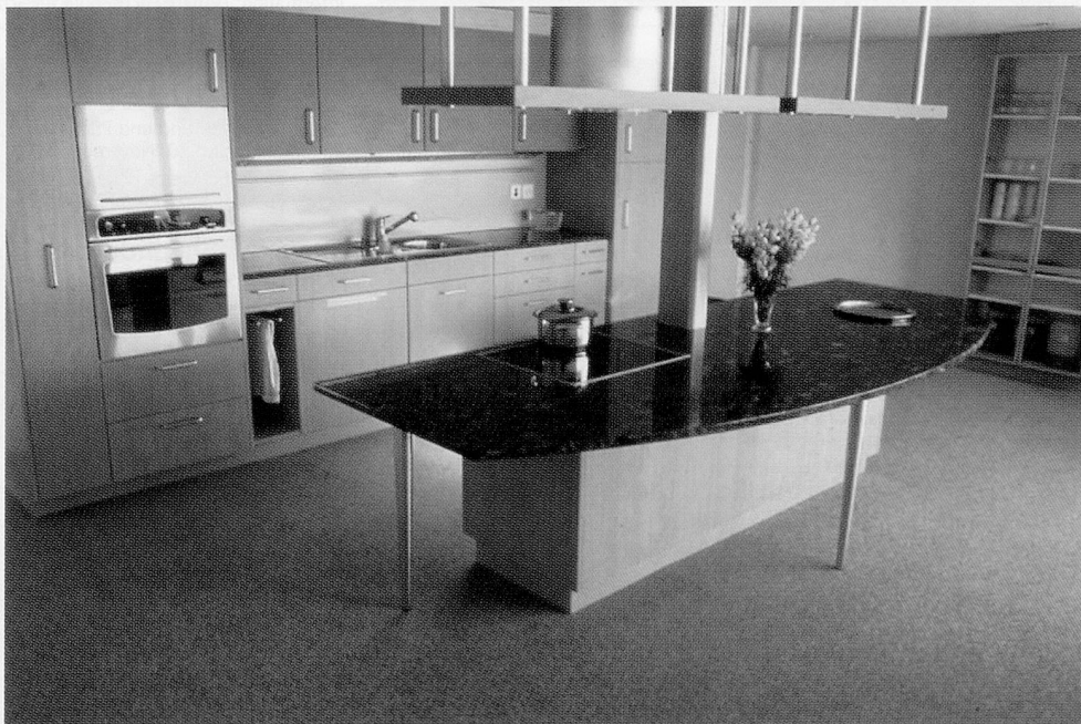
Zweckmässig und modern ist die Wohnküche mit Essplätzen im Alters- und Pflegeheim Tannzapfenland.

Dorfplatz 3 8126 Zumikon Telefon 01/918 14 22 Telefax 01/918 18 84