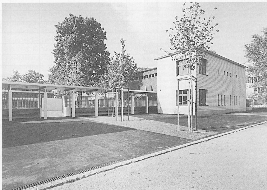
Wohneinrichtungen auf dem Klinikgelände: Das «Sternbild» in Königsfelden.

Annähernd die Hälfte der befragten Institutionen gibt an, dass die Wohngruppen über ein eigenes Finanzbudget verfügen, das sie eigenständig verwalten. So können die Gruppen das Geld eigenverantwortlich verwenden und