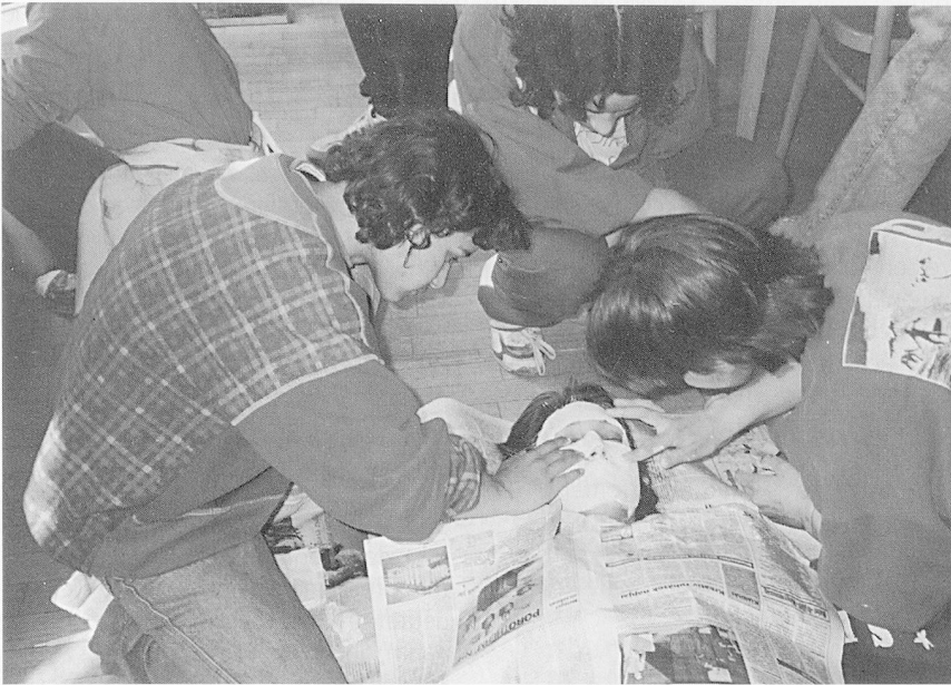
Workshop: Die Materialien näherbringen.

Umständen im Kinderheim landen, gerade hier verunmöglichen eben diese Umstände die wichtige Vorbereitung. Der Teufelskreis.