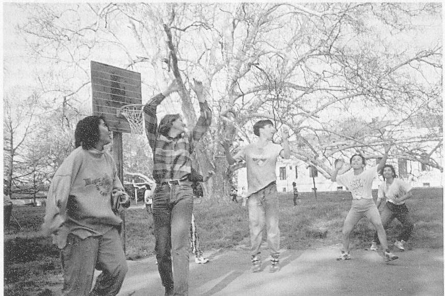
Endlich: Sportliches Spiel, dank Materialien aus der Schweiz.

Die Leitung des Kinderheimes in Cégénydányád hat den Schwierigkeiten den Kampf angesagt, doch auch ihren Erziehungskonzepten macht die schlechte wirtschaftliche Lage einen Strich durch die Rechnung. Besonders in dieser schwach entwickelten Gegend wäre eine gute Vorbereitung auf das selbstständige Leben für die Rückkehr in die Gesellschaft wichtig, da die Umstände so schwierig sind. Doch hier, wo besonders viele Kinder wegen gerade diesen