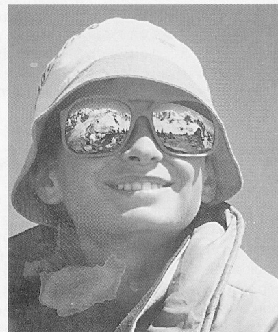
Ein Stück Himmel...

Weshalb fragen wir im sozialpädagogischen Alltag so oft «Wo gab's Probleme?» – statt «Was ist gut gelaufen?» Beobachtungshefte sind voll von Problembeschreibungen, Notizen über erfreuliche Dinge haben Seltenheitswert. Weshalb wohl? Wir sind uns sehr daran gewöhnt, uns mit den negativen Seiten des Lebens herumzuschlagen, ja wir identifizieren uns mit einem Beruf, der es mit Problemen zu tun hat. Die Entscheidung für «lösungsorientiertes Arbeiten» ist deshalb oft verbunden mit einem echten Perspektivenwechsel: Wir kämpfen nicht gegen den Schatten, sondern für das Licht! Dies können wir nur in einer wirklich positiven Gesinnung und einer zutiefst positiven Haltung dem Kind gegenüber. Wo uns der Mut fehlt, dieses Positive zu suchen, gerade neben und in allen Schwierigkeiten und Verhaltensstörungen, ist lösungsorientiertes Arbeiten nicht möglich. Der lö-