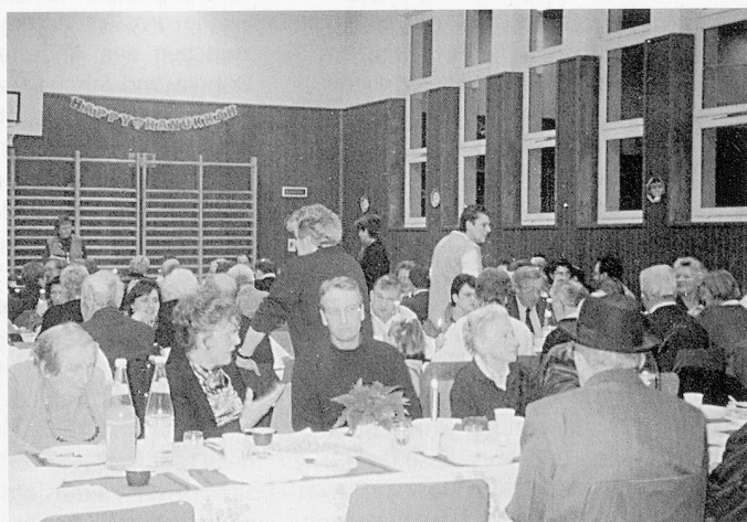
Chanukka-Feier in der Turnhalle des Lengnauer Dorfschulhauses.

Für Sascha Gelbhaus hat die jüdische Kultur und Religion erst in der Schweiz