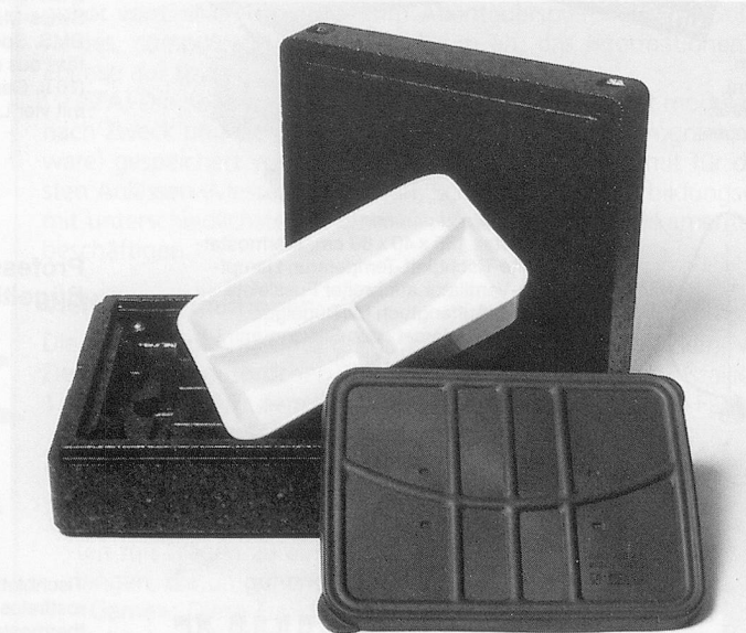
Die Mehrweg-Isolationsverpackung «Dinner Champion» hält vorgekochte Menüs mindestens drei Stunden auf Servier-Temperatur.

generiersysteme für die Kalt- oder Warmlieferung vorbereiteter Spei-