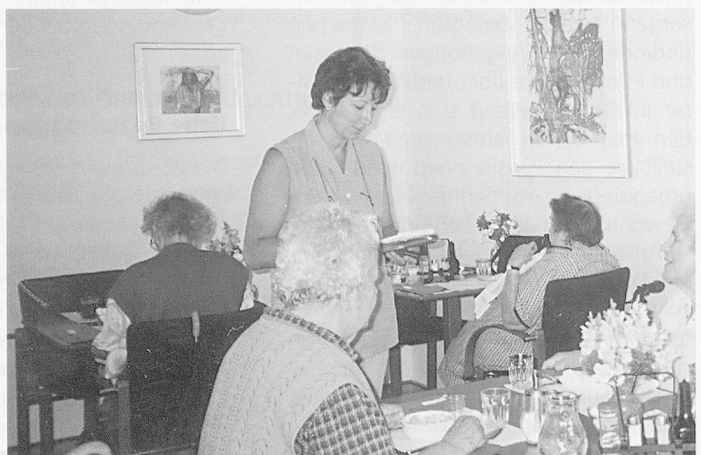
Die Fürsorgerin hat für Sorgen und Anliegen der Bewohnerinnen und Bewohner immer ein offenes Ohr.

Die Fürsorgerin nimmt an den Sitzungen des Stiftungsratsausschusses teil. Hier vertritt sie vorwiegend die Anliegen der Bewohnerinnen und Bewohner. Auch in der Baukommission, welche zur Zeit die zweite Etappe des Ausbaus der EAM – dieses Mal des Altersheimes – plant, besteht die Aufgabe der Fürsorgerin vorwiegend darin, frühzeitig die Bedürfnisse der Bewohnerinnen und Bewohner einzubringen. ■