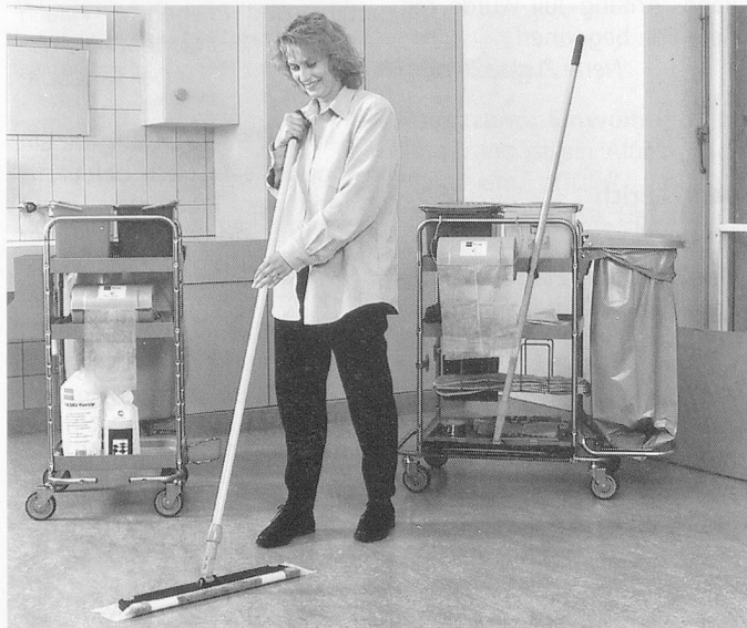
Das neue TASKI florzip Dispenser System

TASKI bietet mit dem neuen TASKI florzip Dispenser System eine Möglichkeit, die den Einsatz der getränkten Einwegtücher noch effizienter macht. Einfache Anwendung; jedes Tuch wird aus dem Dispenser gezogen und ist sofort einsatzbereit. Das Entfalten entfällt. Kein Austrocknen der Tücher weil der Dispenser verschlossen ist und das Öl im Tuch bleibt. Laufende Nachtränkung; durch die Drehung der Rolle beim Abziehen eines Tu-